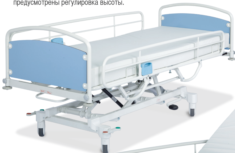
Кровать гидравлическая Salli H - 2 секции

“Простое и функциональное решение для ЛПУ”