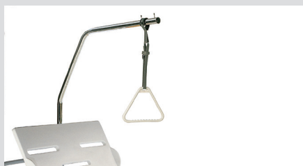
Дуга для активации пациента